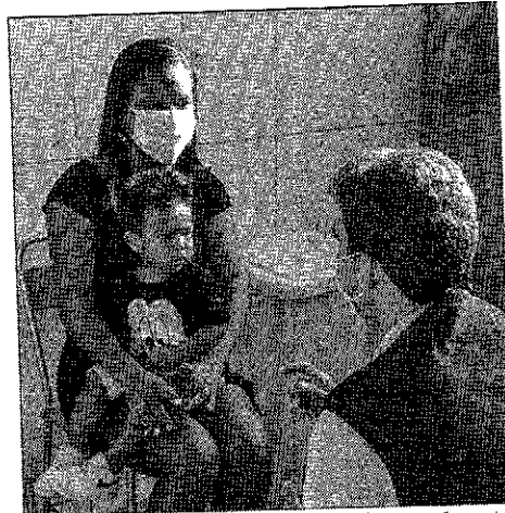
Braide lançou nesta segunda, a campanha de vacinação contra influenza

A primeira etapa da campanha de imunização contra Influenza (H1N1) deste ano segue de 12 de abril a 10 de maio. Neste período, serão vacinadas crianças de 6 meses a menores de 6 anos de idade (5 anos, 11 meses e 29 dias), profissionais de saúde, gestantes e puérperas