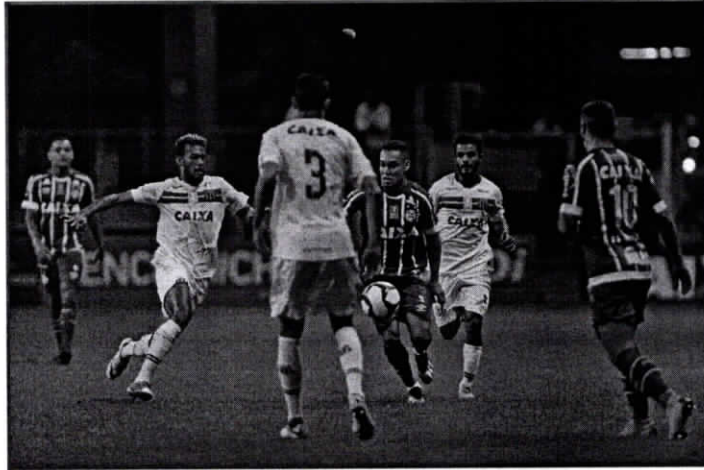
EM SUA ESTRÉIA NO NORDESTÃO, O SAMPAIO VAI ENFRENTAR O TRICOLOR BAHIANO, NA FONTE NOVA

A segunda partida do Sampaio na Copa do Nordeste será dia 30 de janeiro, contra o Altos, em São Luís. No Campeonato