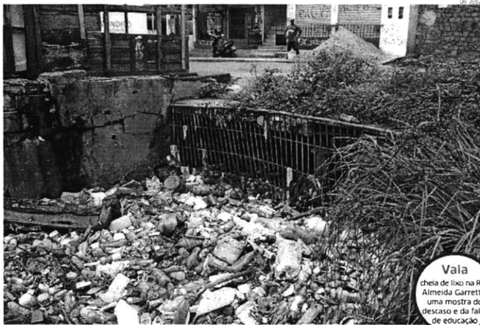
Vala cheia de lixo na Rua Almeida Garrett, é uma mostra do descaso e da falta de educação

Coleta de lixo não consegue atender à demanda em São Luís e situação é agravada pela população, que descarta resíduos de qualquer jeito e em qualquer lugar. O resultado é uma cidade suja. CIDADES 1 E 2