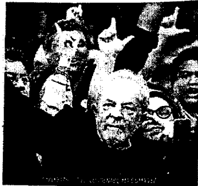
1ª Vara Federal de Curitiba.

Isso porque, conforme os advogados, o recurso foi julgado mesmo diante de recursos pendentes de análise, como o que aponta suspeição de Sérgio Moro. Atual ministro da Justiça, Moro conduziu o início do processo, quando ainda era juiz de