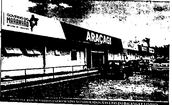
COMISSÃO MUNICIPAL DE MONITORAMENTO DOS CASOS DO CORONAVÍRUS EM SÃO LUÍS

Os resultados iniciais das amostras coletas pelo Lacen saem em até uma semana. Um dos casos foi identificado pela Unidade de Pronto Atendimento (UPA) do Vinkals. A paciente, vinda da Itália, apresentou comprometimento respiratório com sintomas como febre alta, tosse