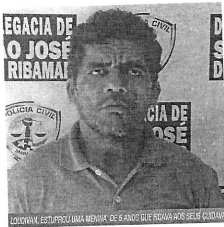
LOUDIVAN, ESTUPROU UMA MENINA DE 5 ANOS QUE FICAVA AOS SEUS CUIDADOS

Após os procedimentos legais, o estuprador foi encaminhado ao Centro Triagem, em Pedrinhas, onde ficará à disposição da Justiça.